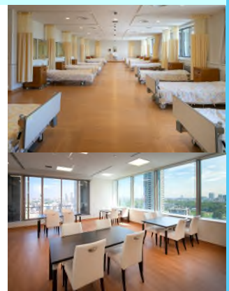
写真: Phase 1ユニット